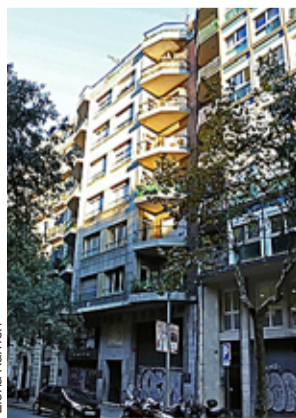
La vivienda, el ámbito más afectado por la inflación.

Respecto a mayo de 2021, los sectores más afectados son vivienda (+16,4%), transporte (+14,8%) y alimentos y bebidas no alcohólicas (+9,3%).