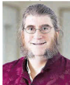
De izquierda a derecha, Ben Bernanke, Douglas Diamond y Philip H. Dybvig, los tres nobeles de Economía.

análisis han sido claves para regular los mercados financieros.