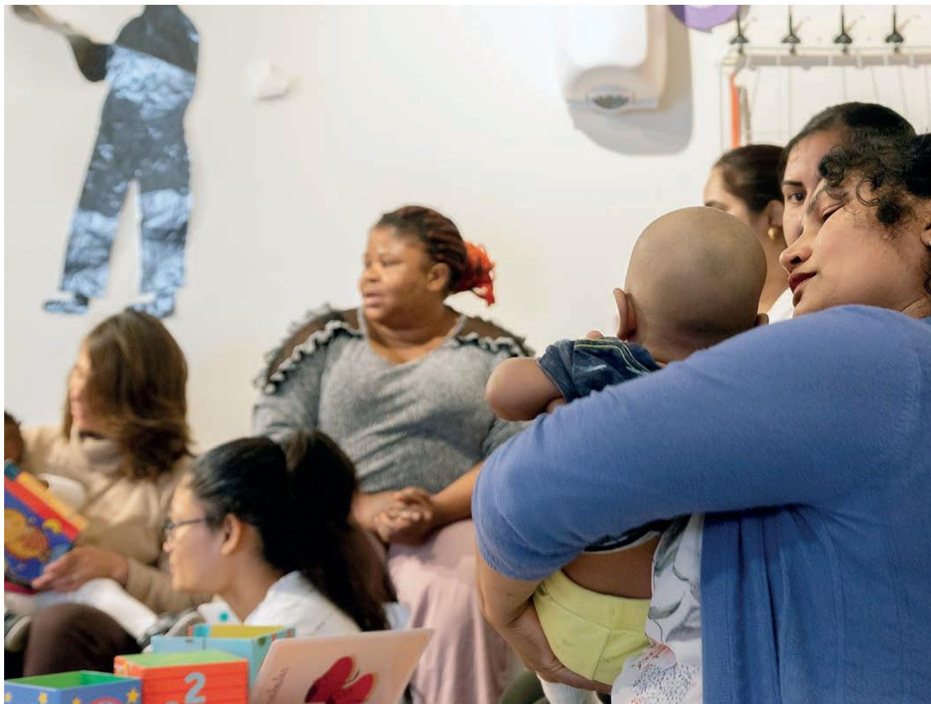
Espai Polivalent de Sant Miquel al barri del Singuerlín de Santa Coloma de Gramenet.

ÁNGEL BELZUNEGUI «El fet que hi hagi tantes entitats no és signe de vitalitat de la societat civil, moltes sorgeixen perquè tenim un Estat del benestar molt feble»